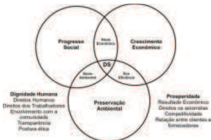
Cuidados com o Planeta - Proteção ambiental - Recursos renováveis - Gestão de resíduos Gestão dos riscos. Figura 1: As três dimensões do Desenvolvimento Sustentável – DS

Maurice Strong e Ignacy Sachs em 1973 formularam um conceito de ecodesenvolvimento na qual defende outra forma de desenvolvimento além das empreendidas até então. Para estas o conceito de Desenvolvimento Sustentável apóia-se em três princípios básicos: o econômico, o social e o ambiental. Como enfatizam Kraemer (2003) e Carvalho e Viana (1998) ao integrar em seu conceito de Desenvolvimento Sustentável as questões sociais (equidade social), ambientais (equilíbrio ecológico) e econômicas (crescimento econômico), constituindo o tripé conhecido como triple-bottom line, conforme gráfico a seguir (Figura 1):